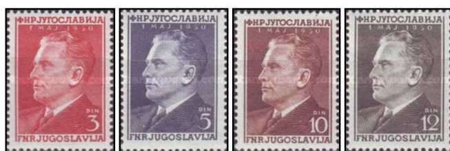
1950 Arbejdernes internationale kampdag