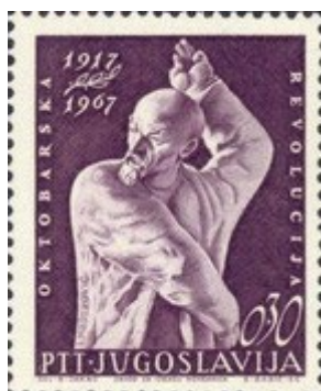
1967 50 året for Oktoberrevolutionen