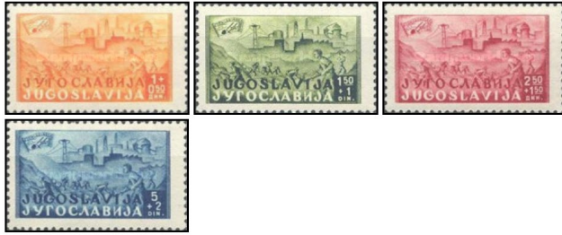
1947 Konstruktion af Samac-Sarajevo jernbanen