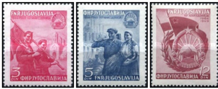
1949 Det 5. jubilæum for dannelsen af Folkets republik