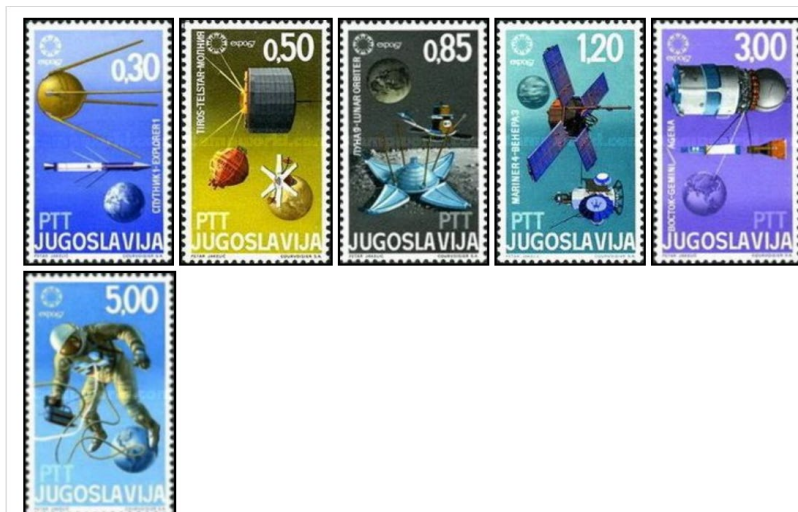
1967 Rum Verdensudstilling Expo '67 Montreal

Alle ovenstående frimærker er fundet på: