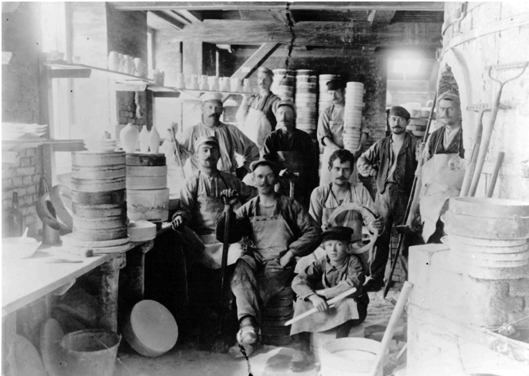
Fotograf ukendt. Bing og Grøndahl, Arbejdsmænd i værksted, Vesterbrogade 149 i København, år 1900: https://kbhbilleder.dk/kbh-museum/29794 (hentet 24.05.22).