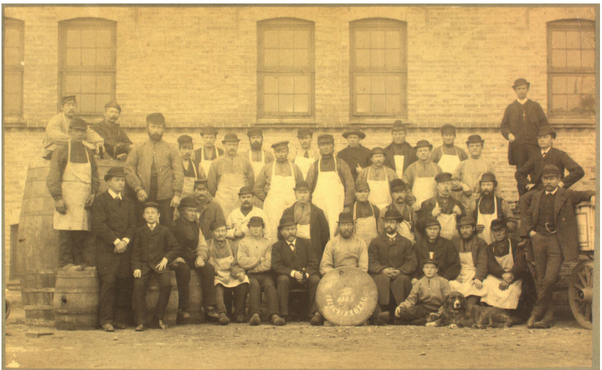
Ansatte ved Frederiksberg Bryggeri, år 1885: https://kbhbilleder.dk/frb-arkiv/1943 (hentet 24.05.22).