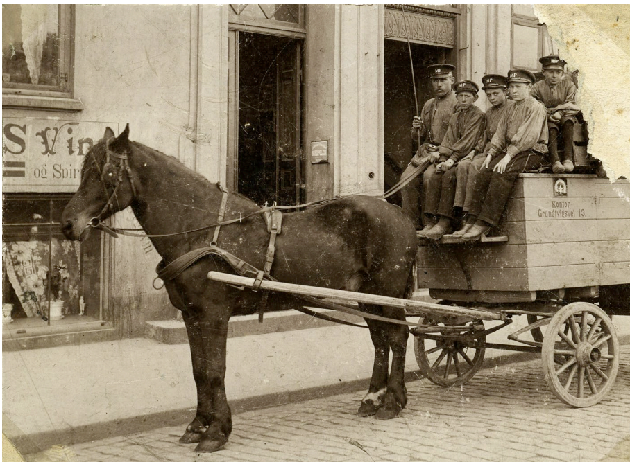
Fotograf ukendt. Mælkevoan fra Mejeriet Pasteur, Grundtvigsvej 13 i København, år 1898: https://kbhbilleder.dk/kbh-arkiv/101506 (hentet 24.05.22).