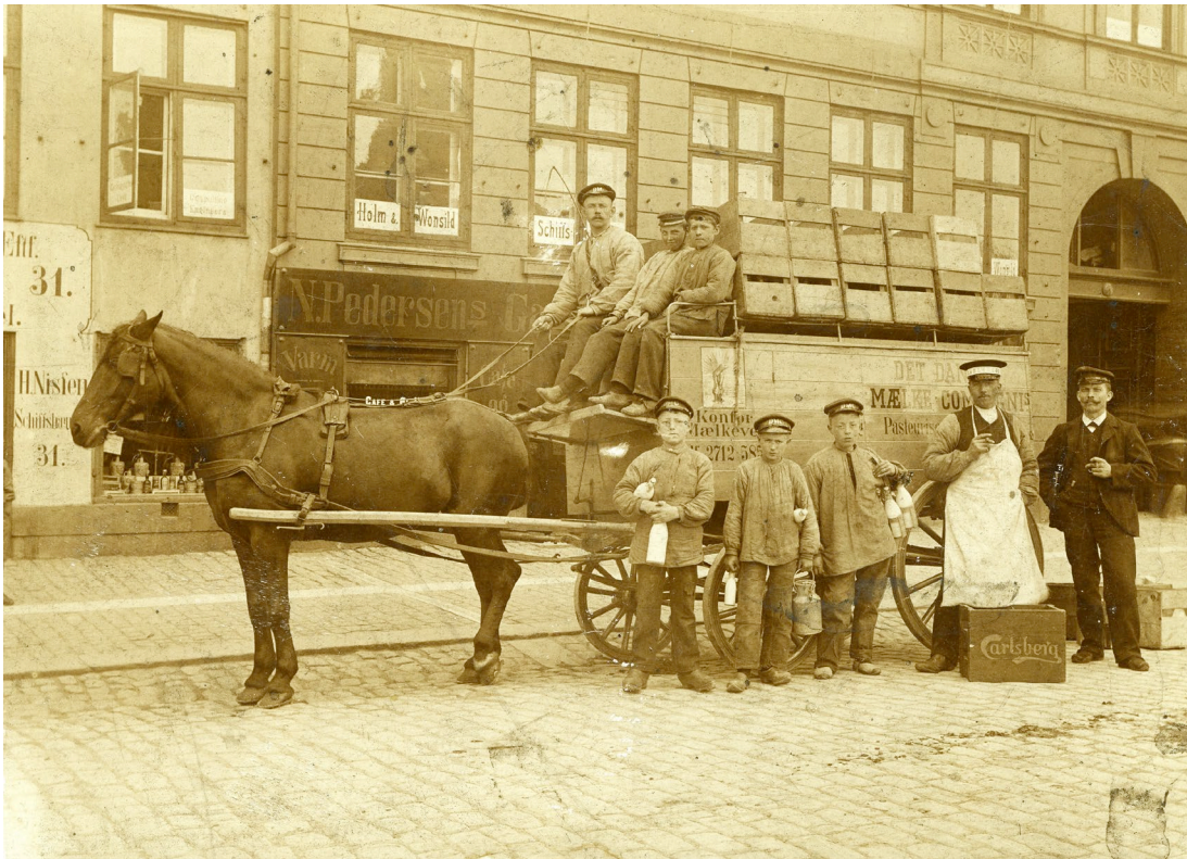
Fotograf ukendt. Mælkevogn med kusk og mælkedrenge i Amaliegade i København, år 1900: https://kbhbilleder.dk/kbh-arkiv/101507 (hentet 24.05.22).