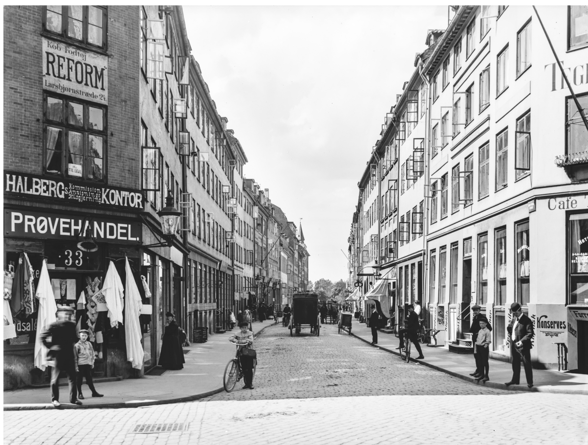
Foto: Johannes Hauerslev. https://kbhbilleder.dk/kbh-museum/65888 (hentet 25.05.22).