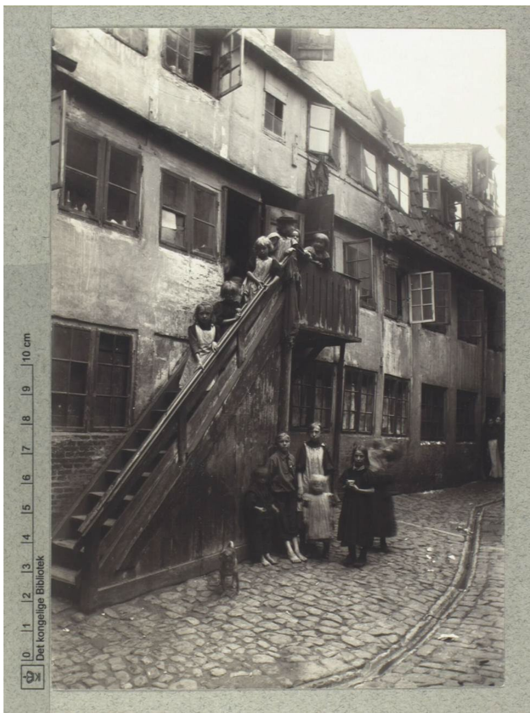
Børn ved Prinsessegade nr. 25. Oprindelsesdato: 1894-1929: http://www5.kb.dk/images/billed/2010/okt/billeder/object429175/da (hentet 25.05.22).